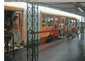
Desarrollo orientado al transporte público en Curitiba