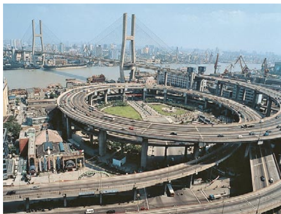
Fig. 2 Puente Nanpu, Shanghai, China. Las grandes carreteras son todavía vistas como símbolos de progreso y modernidad en ciudades en desarrollo. Algunas de las ciudades más ricas – como San Diego – han, por el contrario, eliminado las carreteras elevadas dentro de las ciudades y han interrumpido la expansión de las carreteras.