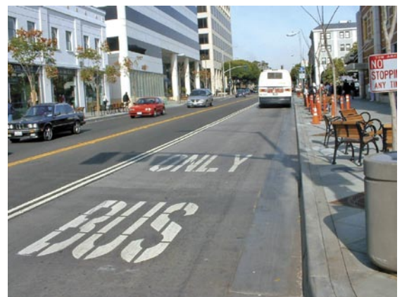
Fig. 6 El condado de Santa Mónica en Los Ángeles está implementando mejoras para peatones, ciclistas y buses, incluyendo el reemplazo de estacionamientos para autos por estacionamientos para bicicletas (derecha).