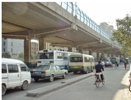
Fig. 5 Además de producir deterioro y contaminación visual, esta vía elevada en Shanghai produce condiciones pobres para los modos más sostenibles: buses, caminar y andar en bicicleta. Los buses pueden verse atrapados en la congestión debajo de la vía elevada; también es un área poco agradable para los peatones.