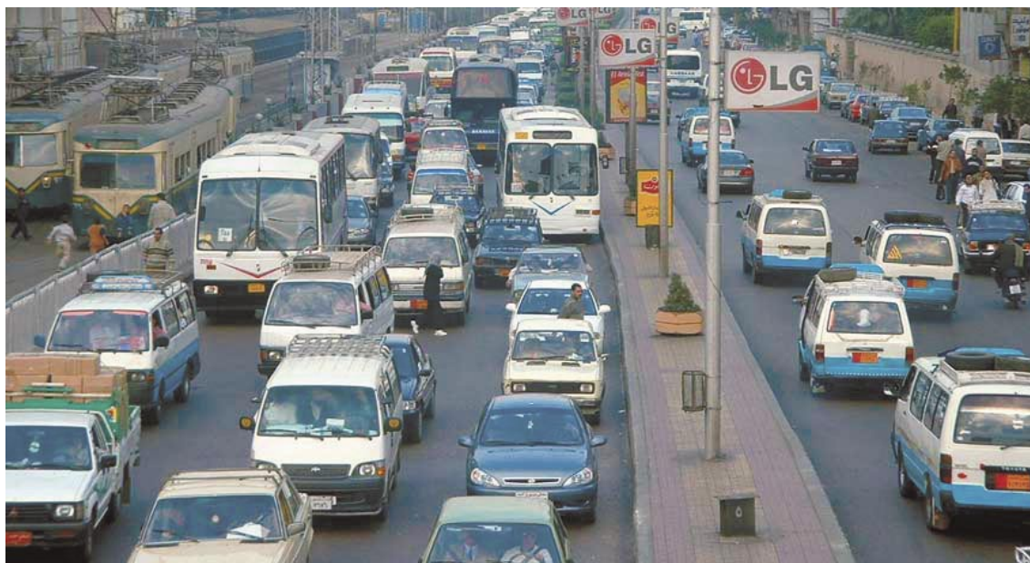
Fig. 1 Una calle congestionada en El Cairo, y el terminal de la última línea de tranvía de El Cairo. Los problemas de transporte en ciudades en desarrollo tienden a empeorar más que a mejorar con el desarrollo económico.

El transporte difiere de otros problemas que las sociedades en desarrollo enfrentan, debido a que, con el desarrollo económico, empeora, en vez de mejorar. Mientras que las condiciones de salubridad, la educación y otros desafíos mejoran con el crecimiento económico, el transporte empeora. El transporte está, a su vez, en el centro de un modelo diferente y más apropiado que debería y podría implementarse en ciudades en desarrollo en el Tercer Mundo. Más que un modelo político-social, el modelo que se describirá es un modelo para una forma de vida distinta en las ciudades; pero tiene profundas implicaciones sociales y económicas. Un verdadero compromiso con la justicia social, sustentabilidad medioambiental y crecimiento económico necesita adoptar un modelo de