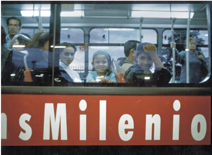
Fig. 12 Las mejoras en Bogotá han significado que los ciudadanos se sientan ahora orgullosos de su ciudad.