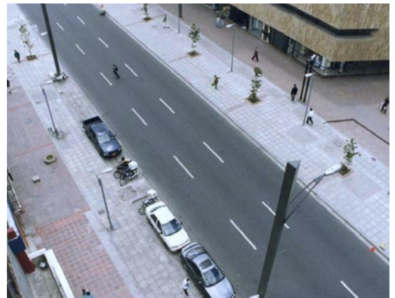
Fig. 3 “Antes” y “después”: mejoras en los estacionamientos y en los espacios públicos en Bogotá.

Enrique Peñalosa, 2001, presentación para el Surabaya City Council