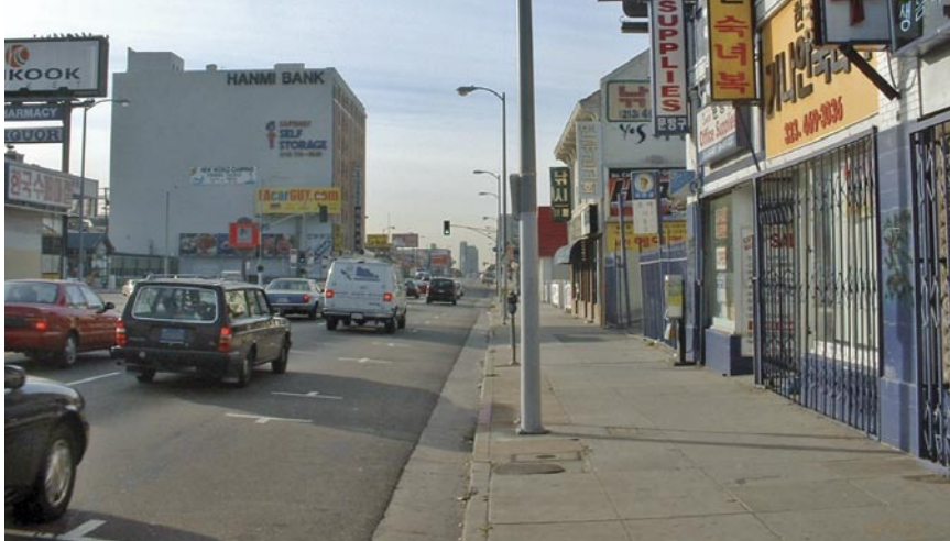
Fig. 4 Escenas del vacío cultural en ciudades de estilo norteamericano orientadas al uso del automóvil contrastan con la riqueza cultural de los escenarios orientados a peatones y ciclistas.

Los Angeles, Enero de 2002 (arriba); Bogotá, Colombia (derecha) (Enrique Peñalosa); Suzhou, China, Enero de 2002 (abajo) (Karl Fjellstrom).