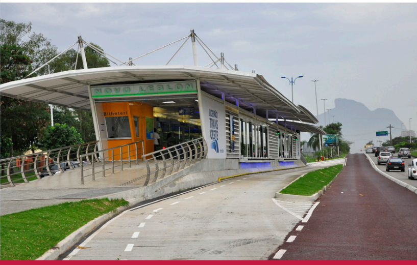
图4: 作为里约BRT网络的一部分, 本地政府出资建造的BRT走廊。 ©Mariana Gil, 巴西里约热内卢

巴士及其运营由“巴西发展银行 (BNDES) 投资维护计划 (BNDES PSI) —资本财物”提供资金。这笔资金针对巴西所有城市的城市车队, 用于鼓励巴士的生产和收购。这些资金作为贷款, 可以占微型企业设备总价值的50%, 中小型最高可达设备总价值的30%。这些贷款直接发放给当地政府(BNDES-PSI, 2012)。