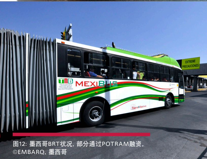
图12: 墨西哥BRT状况, 部分通过PROTRAM融资。