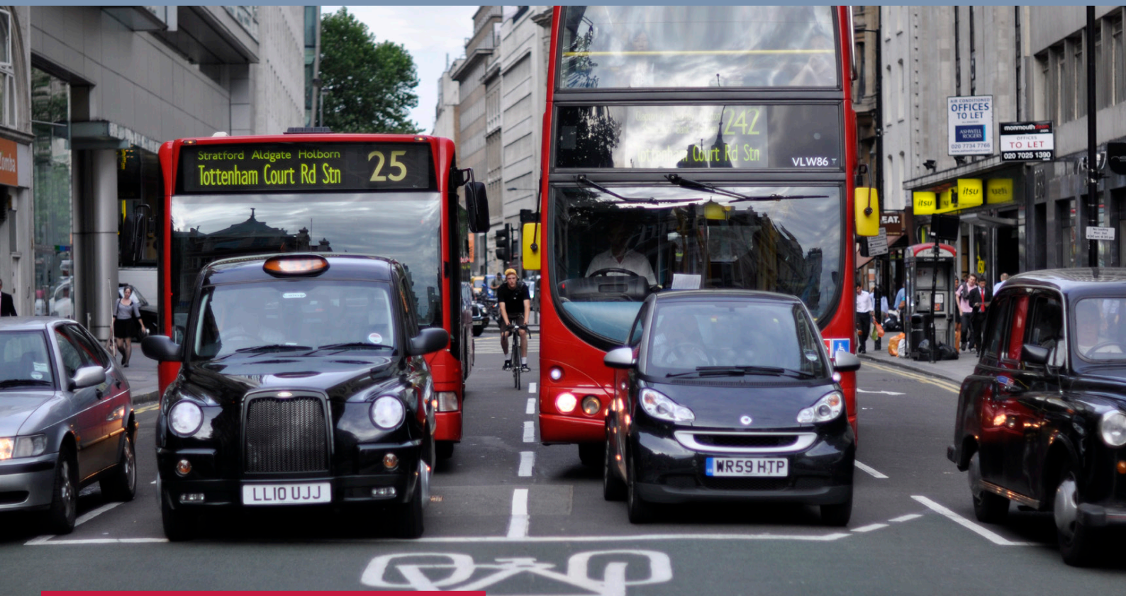
图14: 交通是国家事务: 交通部为整个英国制定交通政策。 ©Carlos Felipe Pardo, 英国伦敦, 2010年