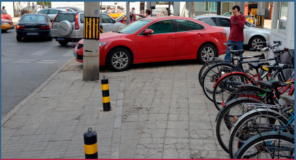
图2: 北京人行道上的的违章停车。 中国北京, 2012年

体制复杂性和协调度缺乏是实现有效规划、设计、建设和维护可持续城市交通系统的核心障碍。各部委分别在不同层面指导城市交通的发展和实施（见上文）。