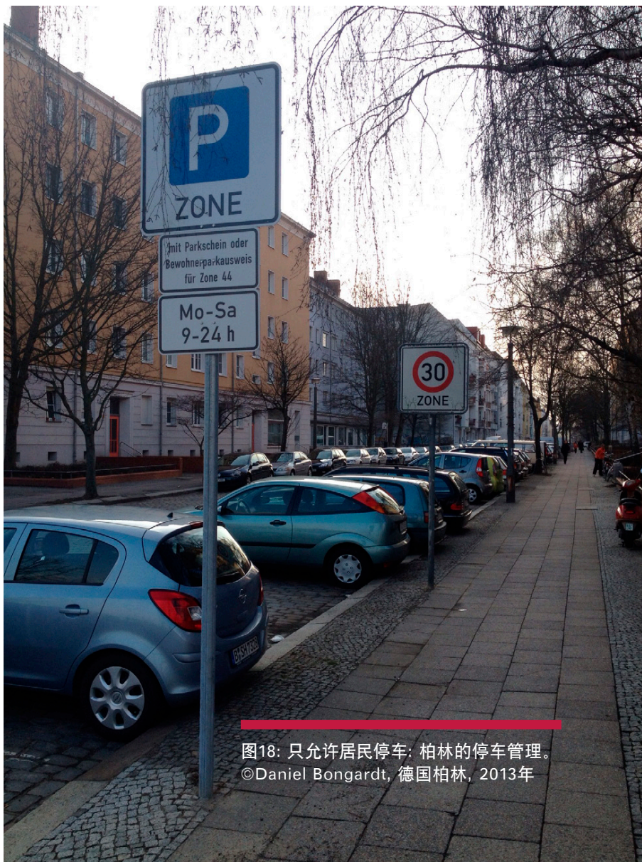
图18: 只允许居民停车: 柏林的停车管理。 ©Daniel Bongardt, 德国柏林, 2013年

由于分散模式高度依赖于训练有素的当地专业团队，因此技术实力是该体系正常运作的关键因素。为了提升当地的技术实力，能力建设的方