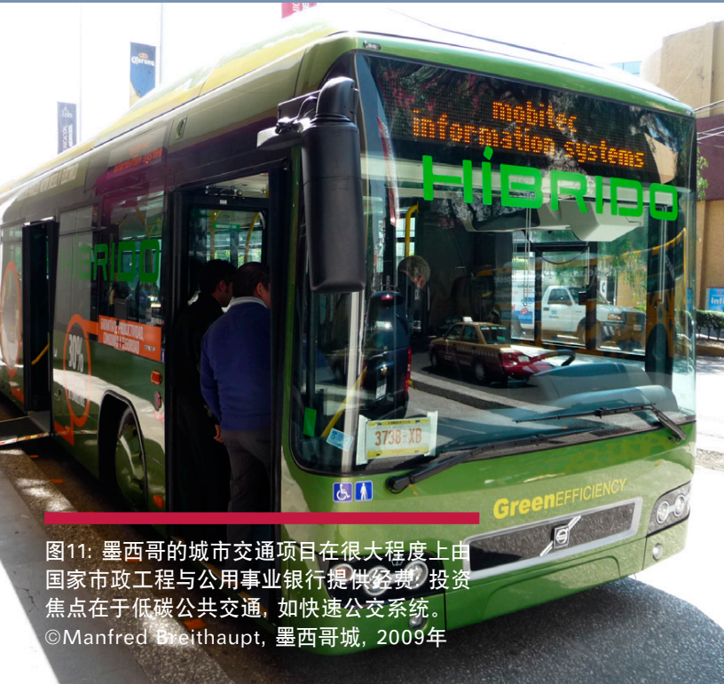
图11: 墨西哥的城市交通项目在很大程度上由国家市政工程与公用事业银行提供经费, 投资焦点在于低碳公共交通, 如快速公交系统。 ©Manfred Breithaupt, 墨西哥城, 2009年