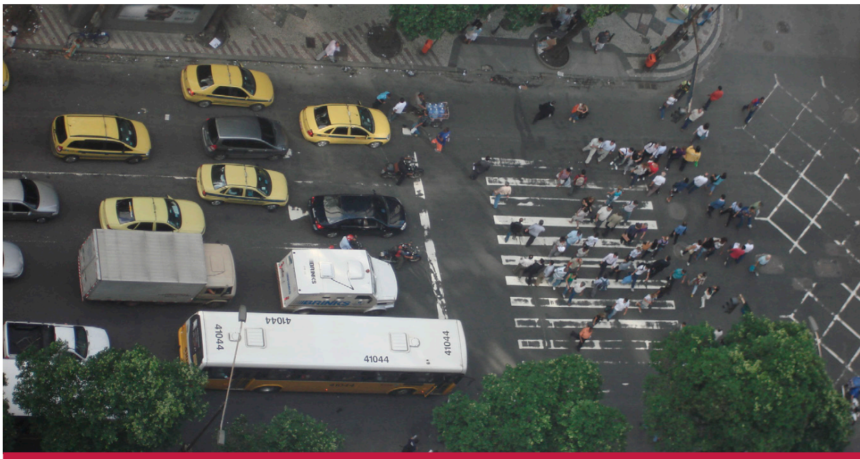
图23: 在巴西, 每个像里约热内卢这样的大城市都必须制定三年交通总体规划。

德国则采用的是分散式模式下的另一种方法, 这种方法基于城市间的互相协作。这种情况下, 地方公共交通规划的开发在大部分的州是强制的。这些规划的实施通常是在若干城市组成的城市群中实施, 由该区域的交通管理部门协调。此外, 德国的很多州 (Länder) 也有着专门的规划流程来确定该地区最有益的项目以及去协调交通领域的相关活动。英国在伦敦区域以外的非管制区域则选择了另外一种方式, 在这些区域内, 任何运营者都可以向当地部门进行建议, 这导致了