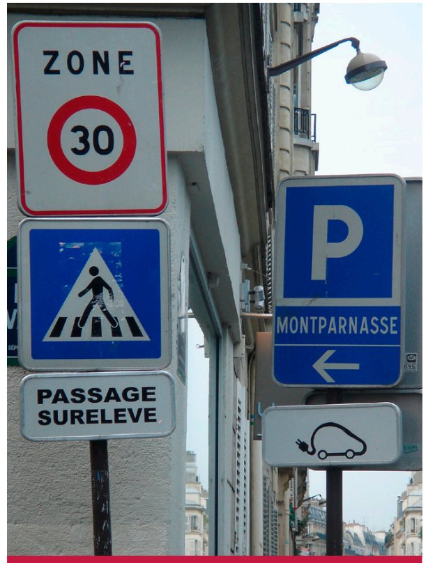
图22: 市内交通组织: 巴黎的交通标志。