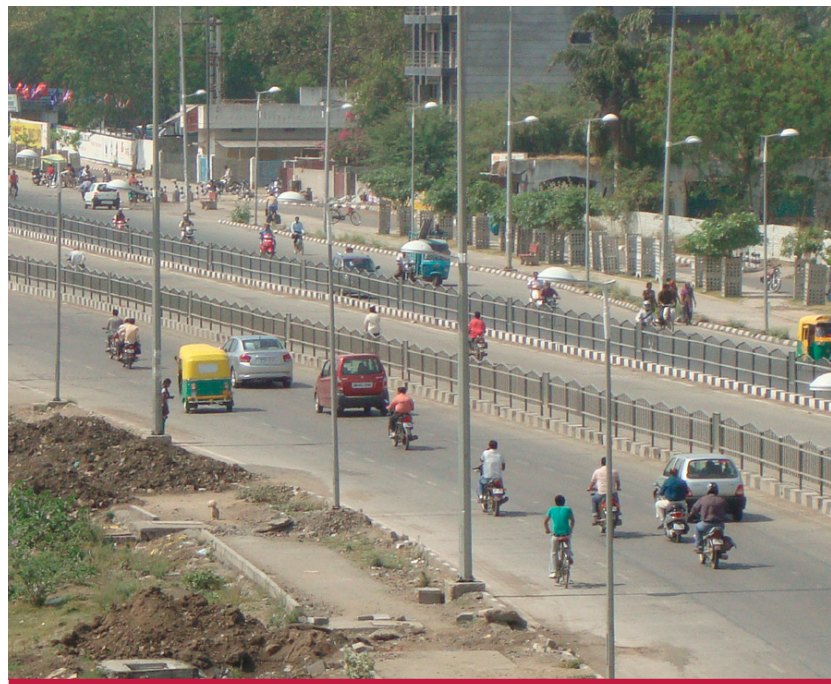
图9：通过JnNURM融资的Indore BRT项目走廊。 ©EMBARQ, 印度, 2013年

除了JnNURM，联邦政府还通过另外两个渠道对交通投资给予支持。一种是在地铁项目中控股50%，另一种则是通过“可行性缺口融资计划”。该计划可以从公共预算中为所有公私合作项目的可行性资金缺口提供最多40%的资金，一半来自于联邦政府。