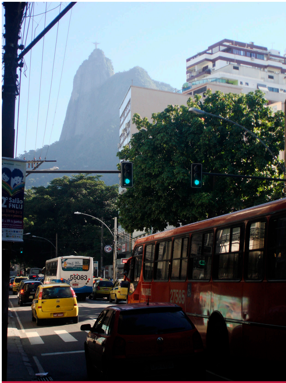
图25: 巴西首都针对巴士、出租车和汽车的绿灯。 ©Lux, 巴西里约热内卢, 2010年

如上所述，缺乏高素质地方团队的国家采用了集中式规划模式和融资方案。在这些国家，地方的能力开发的目标是在项目开发中由各城市的技术团队达成的，这些项目由中央机关指导进行开发（边学边做），也可以通过国家性的培训项目来达成。这种方法将地方知识与国家水平的技术实力相结合。这种类型的计划在极小的经济和人力成本的前提下，向地方政府提供了积极的激励方式，同时使它们能够开展长期的高难度项目。关于发展中国家的培训方案，它们并不只关注项目开发与实施中的技术层面，也同时关注获取解决问题、协商和领导力方面的技能，这几个方面对由众多的不同利益方参与的长期提案起着至关重要的作用。在巴西、墨西哥和哥伦比亚等国，服务运营是建立在上千小型私营业主（其中很多都是非正规的）的联合之上，培训延伸到了官员的范畴以外，包括了私营的系统运营者。高校与非政府组织（NGO）通常会参与到这项工作中，例如墨西哥的Iniciativa计划就一例例子，它专注于培养传统的交通运营者，这些运营者致力于成立正规的城市公共交通管理公司。