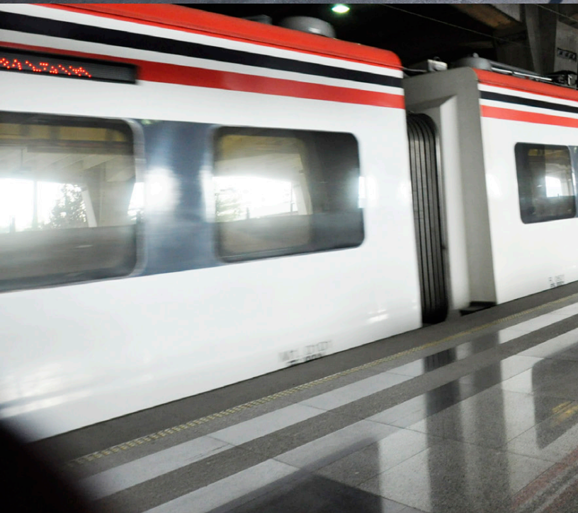
图13: 由PROTRAM融资的墨西哥城郊区列车。