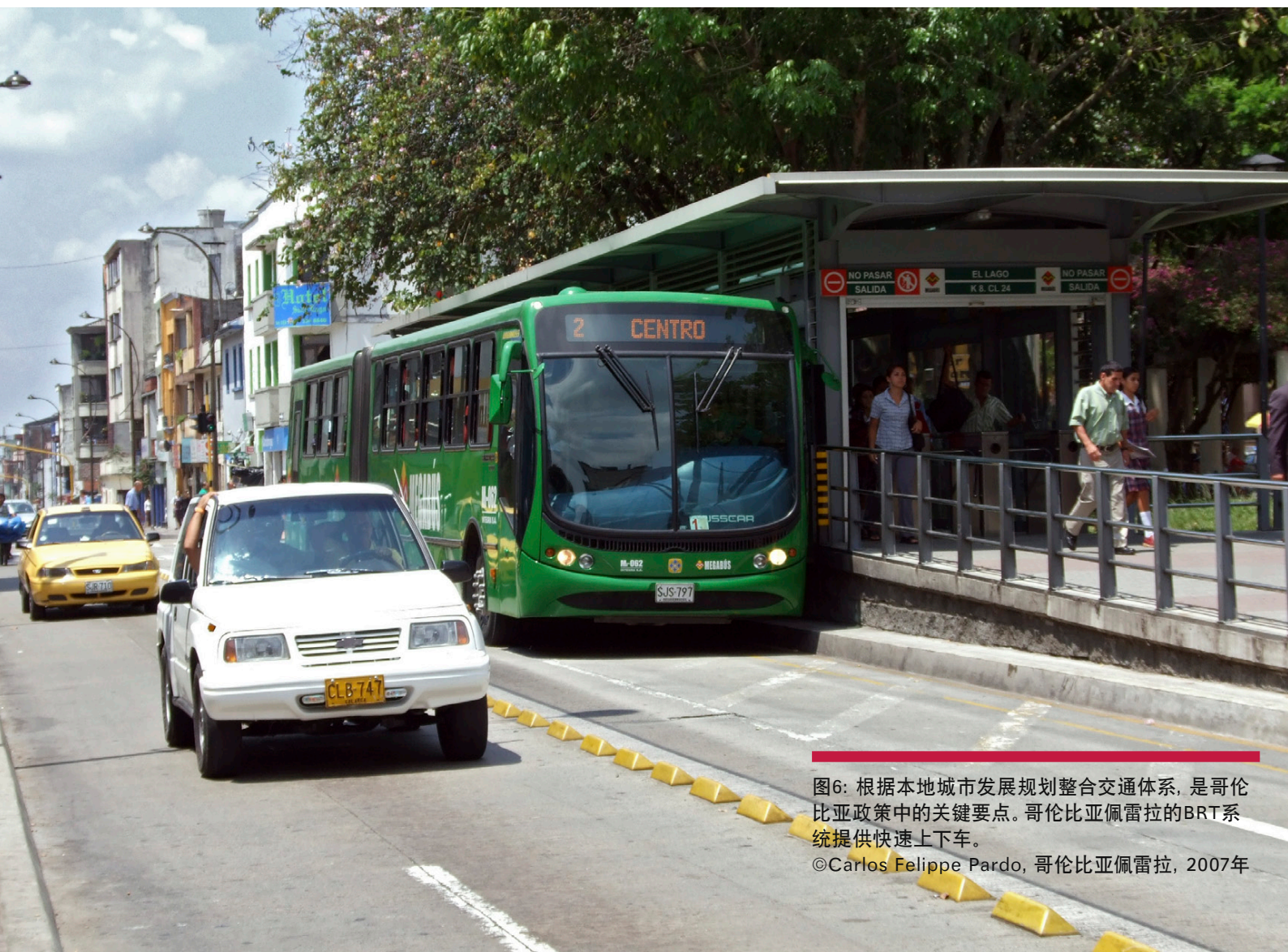
图6: 根据本地城市发展规划整合交通体系, 是哥伦比亚政策中的关键点。哥伦比亚佩雷拉的BRT系统提供快速上下车。

用于基础设施建设的资金由交通运输部通过旨在发展综合公共交通系统 (IMTS) 的城市运输国家计划进行投入，综合公共交通系统包括快速公交 (BRT)、走廊以及支线等。除了发展基础设施之外，该项目同样关注加强体制能力建设。根据不同的规模，每个城市都有具体的一些目标。目前没有用于可持续城市交通系统运营和维护的国家资金 (Hidalgo et al. , 2012)。住房和城市服务方面的其他政策完善了国家对于城市的支持。