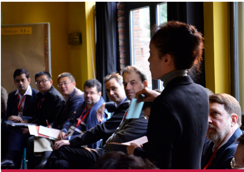
图1: “中国国家级项目以及可持续城市交通基金”研讨会25位国际和国内参加者。