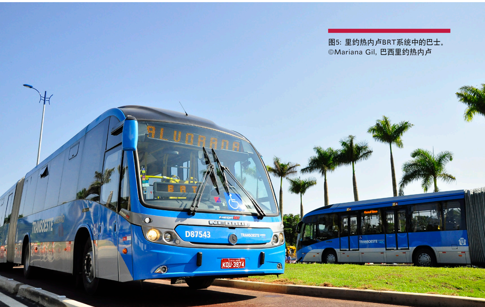
图5: 里约热内卢BRT系统中的巴士。 ©Mariana Gil, 巴西里约热内卢