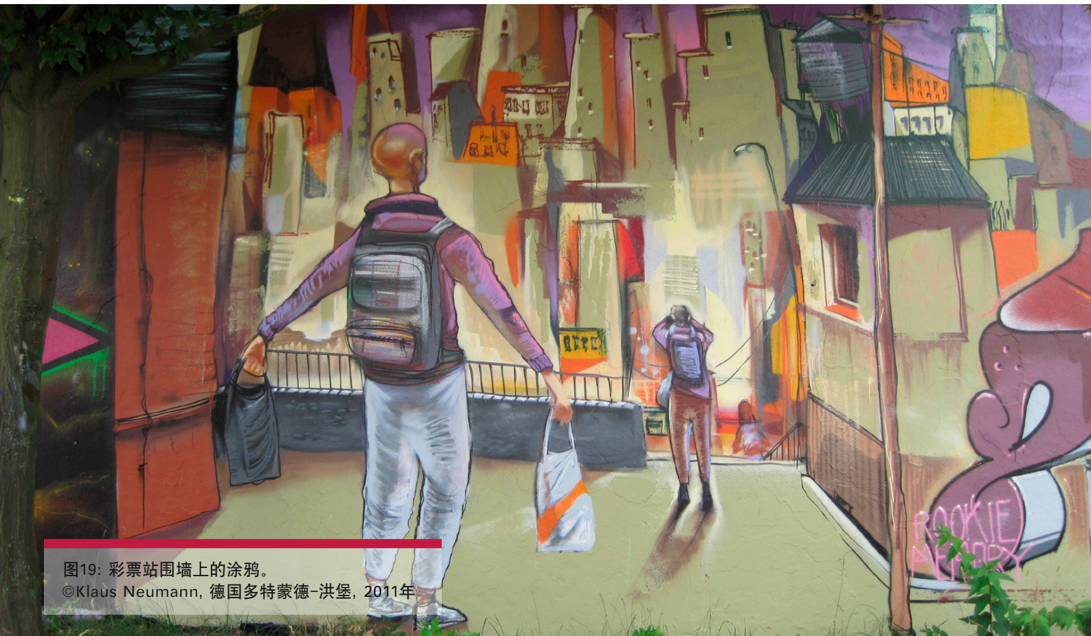
图19: 彩票站围墙上的涂鸦。

巴西在城市交通方面有着国家性的政策, 相对于私有机动车, 它给予非机动车辆和公共交通运输更多的优先权。然而, 管理公共交通的职责却属于地方政府。国家政府只对项目开发-由地方