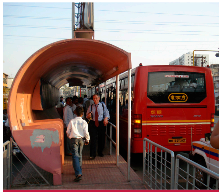
图17: 印度的便利上下车: 乘客们在快速公交车站上下车。 ©Kodukula, 印度浦那, 2008年

两种模式没有优劣之分,在制定公共交通政策时,要仔细地将两种模式存在的优势与劣势纳入考虑范围。此外,融资方案的设计需要和该国的政治、文化及制度的传统和地方产能相适应。因此,中央政府面临的挑战并不是选择某一种模式,而是如何将两种模式的不同元素进行最佳组合以满足国家性和地方性的需求。从该层面上说,每个国家的物质、经济、社会、历史和文化的特征将决定什么是最适合它们所辖城市的交通规划。依此逻辑,可利用的人力及财政资源将在很大程度上决定着每种模式的相关性与适应性。集中式融资方案适用于资金密集型项目,多被发