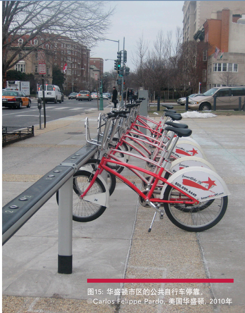
图15: 华盛顿市区的公共自行车停靠。 ©Carlos Felipe Pardo, 美国华盛顿, 2010年

美国涉及贷款的交通项目比例正在日益上升。自1999年以来,交通基建金融与创新法案(TIFIA)项目已为22个项目共计提供79亿美元贷款,所涉及的基建项目投资总额为294亿美元。4个TIFIA项目(占所有TIFIA项目的18%)针对公共交通,同时,TIFIA已为公共交通项目提供12.3亿美元的信贷援助,占总额的16%。(USDOT 2013)