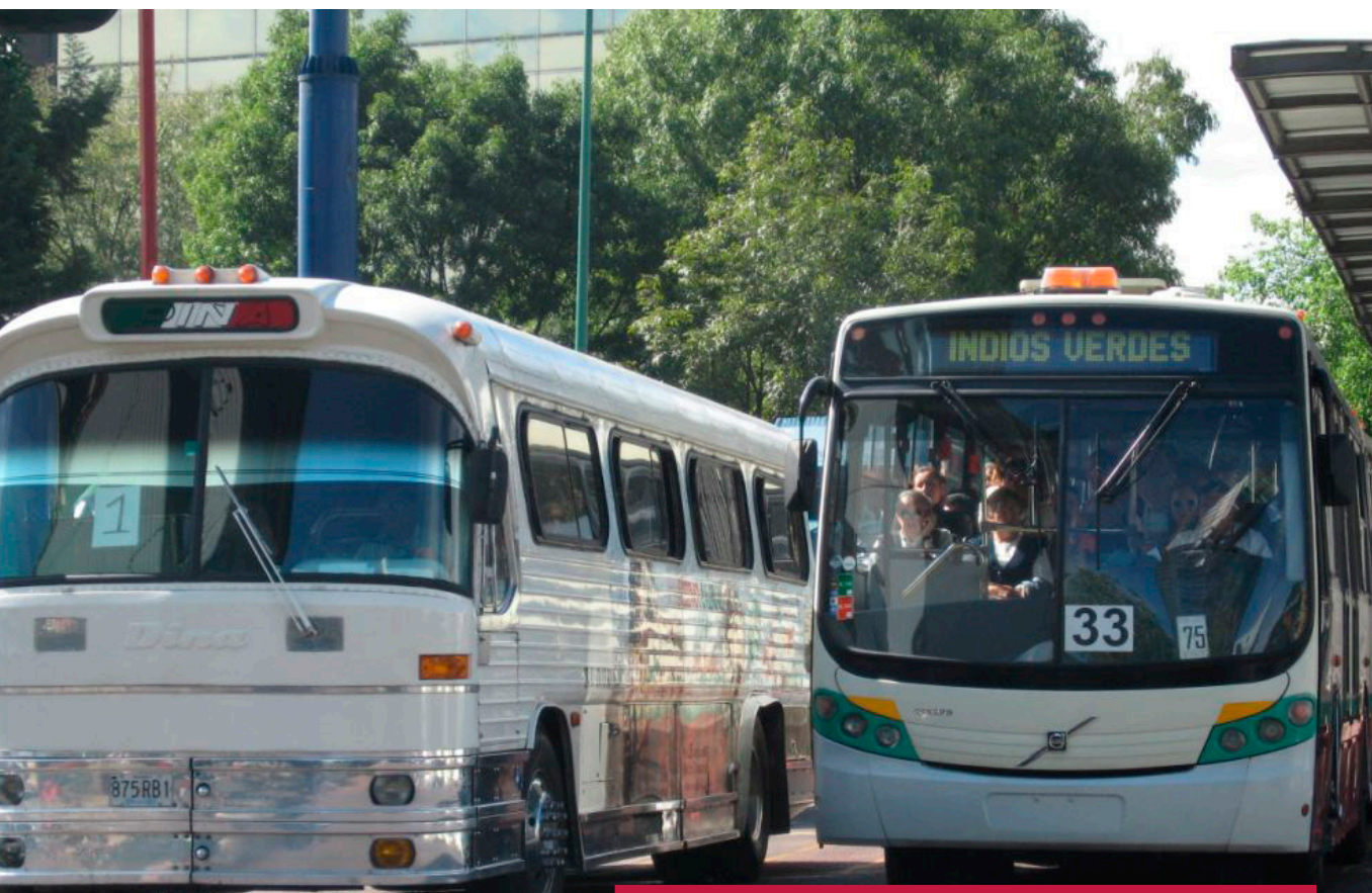
图24: 未来与过去: 墨西哥首都的两辆巴士。 ©Carlos Felipe Pardo, 墨西哥城, 2009年

评估后的国家性方案和规章制度将地方技术能力开发定义为可持续性城市交通系统在合理规划、实施和操作中的关键性因素。对于当地政府, 尤