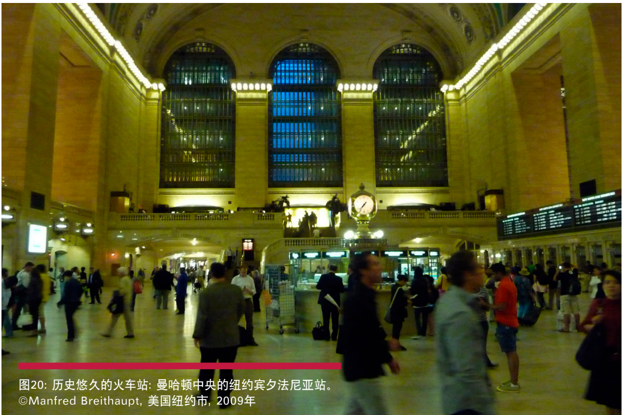
图20: 历史悠久的火车站: 曼哈顿中央的纽约宾夕法尼亚站。 ©Manfred Breithaupt, 美国纽约市, 2009年

在大部分被调研的国家方案中,中央政府建立了一种与地方政府分摊成本的模式,这样政府