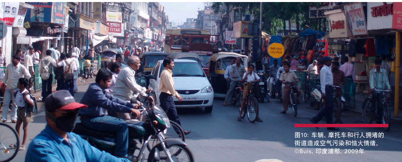
图10：车辆、摩托车和行人拥堵的街道造成空气污染和恼火情绪。 ©Buis, 印度浦那, 2009年