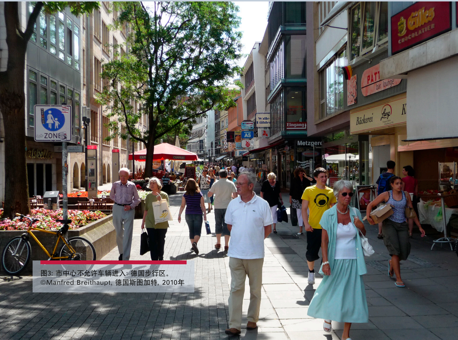
图3: 市中心不允许车辆进入: 德国步行区。 ©Manfred Breithaupt, 德国斯图加特, 2010年

铁的运营而言,北京市政府在2012年补贴了人民币36.9亿(美元5亿)(北京新闻,2013)。