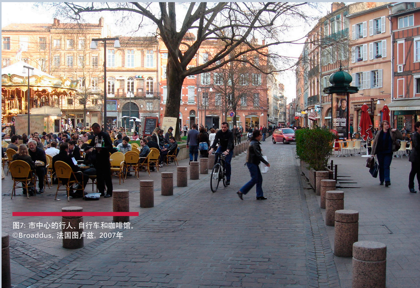
图7: 市中心的行人、自行车和咖啡馆。 ©Broaddus, 法国图卢兹, 2007年

地方政府为运营投入资金，在地区层面上用于发展铁路运输，在部门层面上发展部门内部巴士，在城市层面上用于发展城市交通。因此，在运营融资方面，中央政府几乎不参与（为校车网络提供资金以及为失业或低收入家庭提供“社会”票价优惠则是例外情况）。