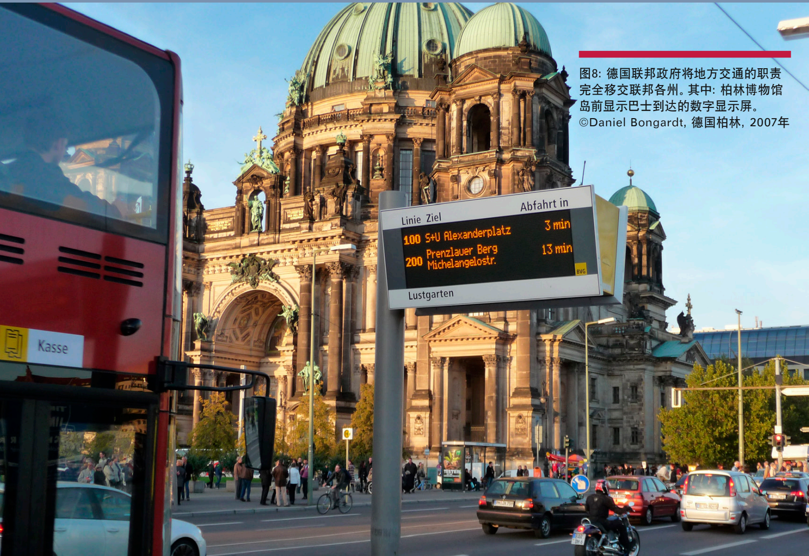
图8: 德国联邦政府将地方交通的职责完全移交联邦各州。其中: 柏林博物馆岛前显示巴士到达的数字显示屏。 ©Daniel Bongardt, 德国柏林, 2007年