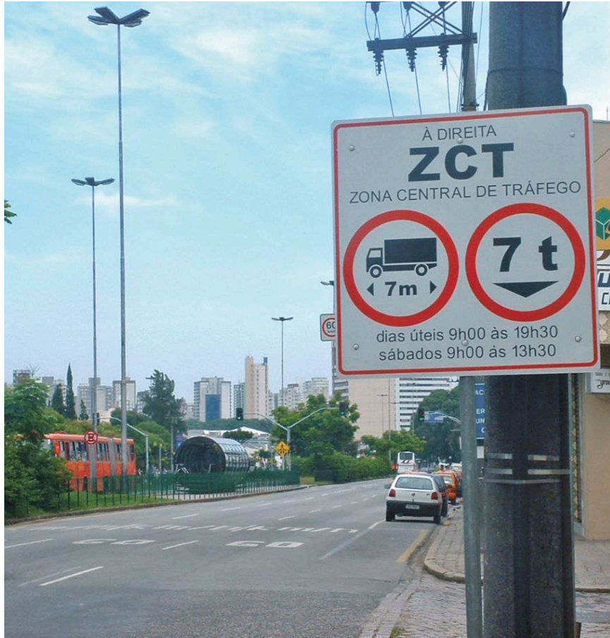
图6 库里提巴道路交通系统在中心交通地带限制重型和加长车辆。