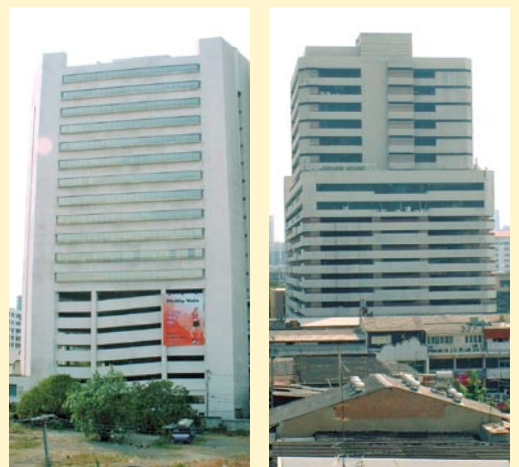
Karl Fjellstrom, 2001.12

曼谷还实施了一项政策，规定了新建筑的停车设施的最小规模。这是由于10层或10层以上的许多建筑都配备停车场（见下图）。由此可以预测产生的拥挤，例如，当一个具有200个住户的公寓楼 - 每个人都拥有泊车位 - 而早上需要开车穿过狭窄的街道去工作。除了过多的泊车位的原因，在许多最需要停车的场所停车场却很缺乏：如紧靠对外的曼谷天空列车MRT线路的车站。